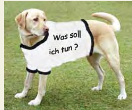
Originalquelle: http://en.wikipedia.org/wiki/File:YellowLabradorLooking_new.jpg - modifiziert Nora Heinzelmann und Anna Stöckl

Eine zeitgenössische Theorie der moralischen Urteilsbildung stammt beispielsweise von dem amerikanischen Psychologen Jonathan Haidt . Gemäß seinem so genannten »sozial-intuitionistischen Modell« formen Menschen normalerweise intuitiv eine moralische Überzeugung. Haidt zufolge ist dabei das soziale Umfeld von herausragender Bedeutung. So übernimmt man schneller und leichter die Meinung einer Person, wenn