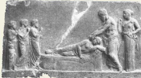
Thomas Schnalke/Institut für Geschichte der Medizin der Friedrich-Alexander-Universität Erlangen: Asklepios. Heilgott und Heilkult. Katalog zur Ausstellung, Erlangen 1990. Nr. 9.

Ebenso gibt es aber auch Stimmen der Antike, die diesen Dienstleistungen kritisch gegenüberstehen und damit gleichzeitig ihre eigenen professionellen Interessen vertreten: Bereits im 5. Jahrhundert v. Chr. wird in gelehrten Schriften argumentiert, dass die Ursache von Krankheiten in Umwelteinflüssen und falscher Lebensweise liege, die die ausgewogene Mischung der Körpersäfte stören und dadurch Krankheit