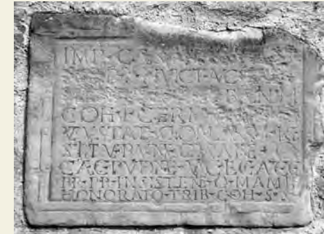
Römische Bauinschrift, auf der die Namen der erbauenden Kaiser ausgetilgt wurden.

In einem zweiten Teil des Kurses werden verschiedene historische Konzeptionen von Erinnern und Vergessen vorgestellt werden. So gab es in römischer Zeit die Praxis der »damnatio memoriae«, die zum Zerstören von Statuen und anderen öffentlichen Relikten von in Ungnade gefallenen Personen führte. Das mittelalterliche Totengedenken äußerte sich unter anderem durch Stiften von Klöstern, Kirchen und Totenmessen,